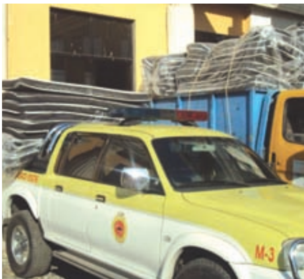
Parte de los 8 camiones y camionetas que transportaron la donación del ASDE a la Defensa Civil Dominicana para los damnificados del terremoto de Haití