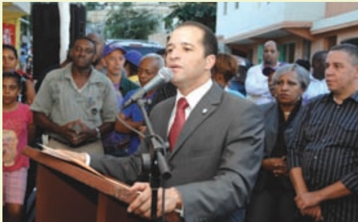
El Alcalde Juan de los Santos explicando, como es su costumbre, las ejecutorias de las obras del Presupuesto Participativo que aprueban los munícipes y ejecuta el ASDE.

ejecutarían a través del tercer Presupuesto Participativo. • Juramentación de 73 diferentes patronatos para velar por el buen funcionamiento de las instalaciones deportivas, parques, multiosos y Centros de Capacitación en Informática. • 260 delegados se juramentaron como miembros de los Comités de Auditorías Sociales de las obras del Presupuesto Participativo