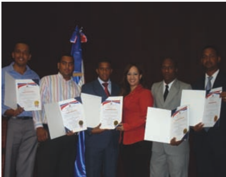
Los jóvenes empleados del ASDE muestran los certificados que los acreditan con el merecido premio "Liderazgo Profesional", a quienes exhortamos a seguir creciendo y aportando con sus conocimientos y trabajo al engrandecimiento de la Patria y su municipio Santo Domingo Este.